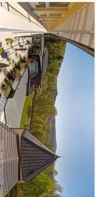
Petra Martin Memorial House

Der Kurs wird durch eine Assistenz begleitet, um organisatorische und auch emotionale Bedürfnisse bestmöglich im Blick zu haben.